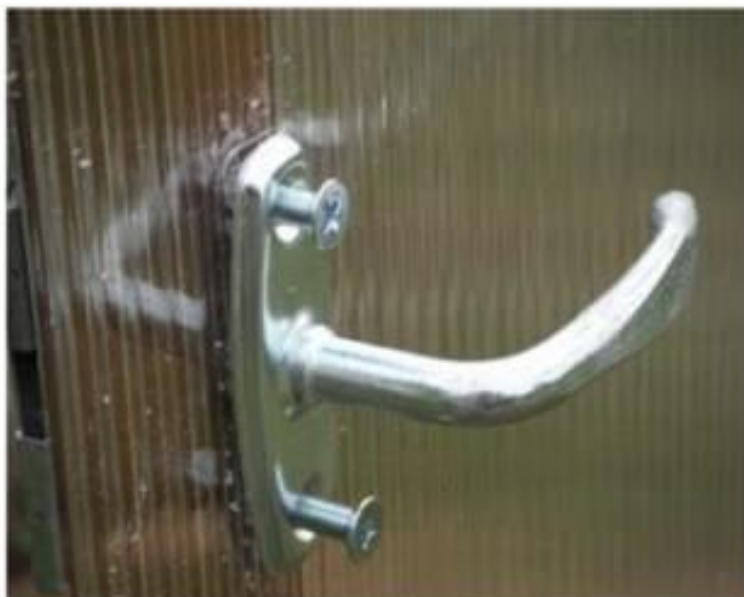
Крепление саморезами по металлу.

Ручки устанавливаются на торцы (дверь и форточка) снаружи поликарбоната